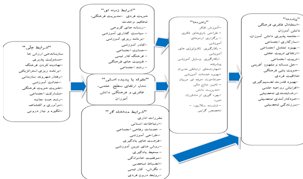
شکل ۱. مدل پارادایمی ارتقای سطح علمی، فکری و فرهنگی دانش‌آموزان در کانون‌های فرهنگی - تربیتی کمیته امداد

مدل ارتقای سطح علمی، فکری و فرهنگی دانش‌آموزان کانون‌های فرهنگی - تربیتی کمیته امداد چگونه است؟