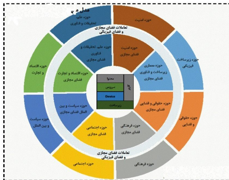
شکل شماره ۱. مدل مفهومی فضای مجازی

ولی در این مدل، اشاره‌ای به ذی‌نفعان نشده است؛ درحالی‌که یکی از مسائل اصلی در حکمرانی فضای مجازی مقوله ذی‌نفعان است که باید جایگاهشان در مدل مفهومی روشن شود. ذی‌نفعان فضای مجازی در یک مقوله‌بندی اولیه شامل: حکومت، بخش خصوصی داخلی، بخش مردمی، بازیگران بین‌المللی (همسو و غیرهمسو) و... است. فلذا مدل مذکور را می‌توان به مدل سه‌بعدی ذیل ارتقا داد: