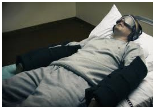
شکل ۱- شرایط آزمایشگاهی محرومیت نسبی حسی

در این وضعیت، فرد احساس تنهایی شدید می‌کند و دچار افسردگی و هیجان‌های متغیری مثل غم یا شادی مفرط می‌شود. چنانچه این شرایط ادامه یابد، شخص در ابتدا دچار توهمات سمعی و بصری نیز می‌شود و حالتی منفعلانه و تلقین‌پذیر پیدا می‌کند (Zuckerman, 2007, P.71). در این شرایط است که با تلقین‌های خاص و پرسش‌های مکرر، اطلاعاتی را از ذهن فرد بیرون می‌کشند و به‌جای آن، اطلاعات مورد نظر خود را به او تزریق می‌کنند (ایروانی، ۱۳۸۸، ص ۲۵۷).