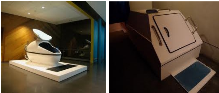
شکل ۲- نمونه‌ای از محفظه‌های ایجاد محرومیت حسی

بر این اساس، امروزه محفظه‌هایی طراحی شده است (شکل ۲)، تا فرد را از ادراکات حسی محیطی رهایی بخشد. هدف از طراحی چنین محفظه‌هایی رسیدن به آرامش، فراموش کردن وقایع تلخ یا مقابله با دردهای مزمن است. این محفظه‌ها، هر کدام با ویژگی خاص خود، توان دستیابی به اهداف ویژه‌ای را دارد. بعضی از آن‌ها از آب پر شده، تا شخص واردشونده، احساس غوطه‌ور شدن و رهایی از جاذبه را نیز تجربه کند.