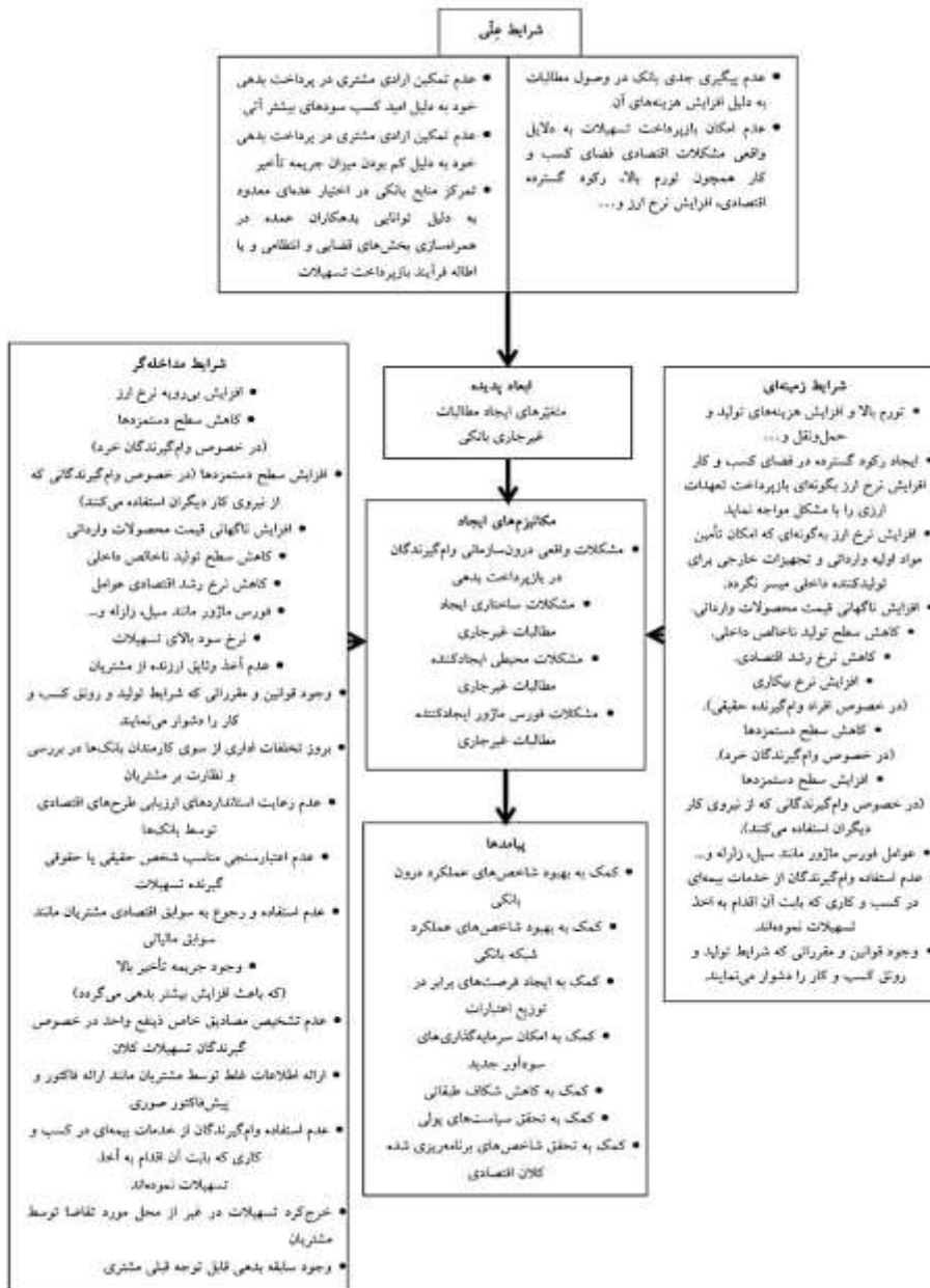
نمودار (۳): مدل پارادایمی تعیین متغیرهای تأثیرگذار بر مطالبات غیر جاری بانکی کشورمان